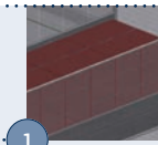
1 Podwyższona podłoga kasetonowa Neptunus