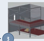
3 Schafft zusätzlichen Platz